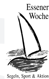
Segeln, Sport & Aktion